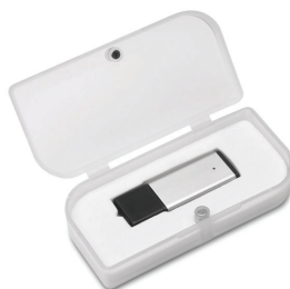
Custodia in plastica frosted