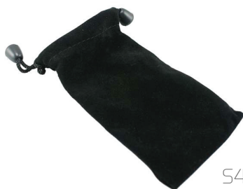
Pouch in velluto nero