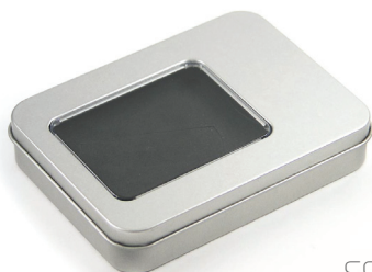
Box in metallo con finestra